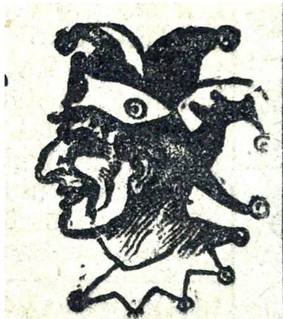
Zeichnung aus über 100 Jahre alten Karnevalsanzeigen Würselener Vereine